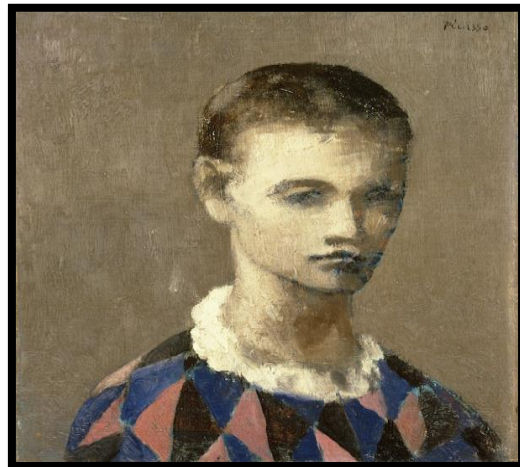
Testa di arlecchino, 1905 P. Picasso