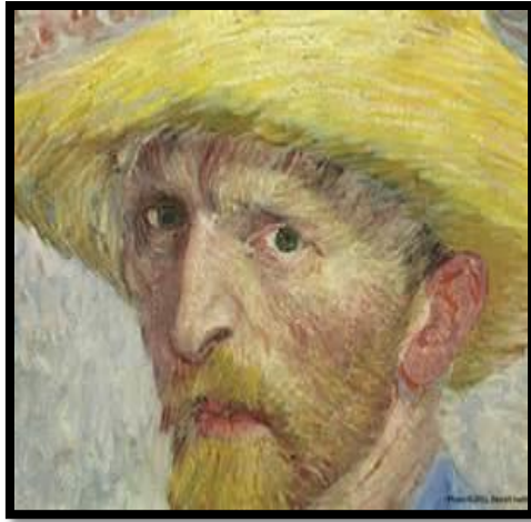
Autoritratto con capello di feltro, Vincent Van Gogh