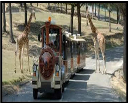
Trenino e giraffe

Il parco si può visitare con la propria automobile o coi i trenini che ci sono all' interno del parco.