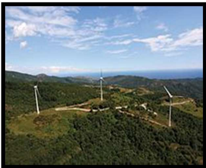
Il parco eolico delle Cinque Stelle.

Oltre alla torre c'erano una locanda per i viaggiatori, le stalle e delle mura che servivano come protezione.