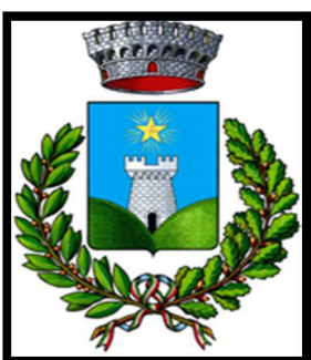
Stemma di Stella.

che si incontrano, la torre e una stella a cinque punte come i cinque paesi di Stella.