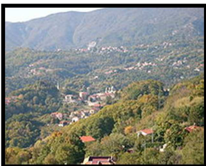
Panorama di Stella San Giovanni.