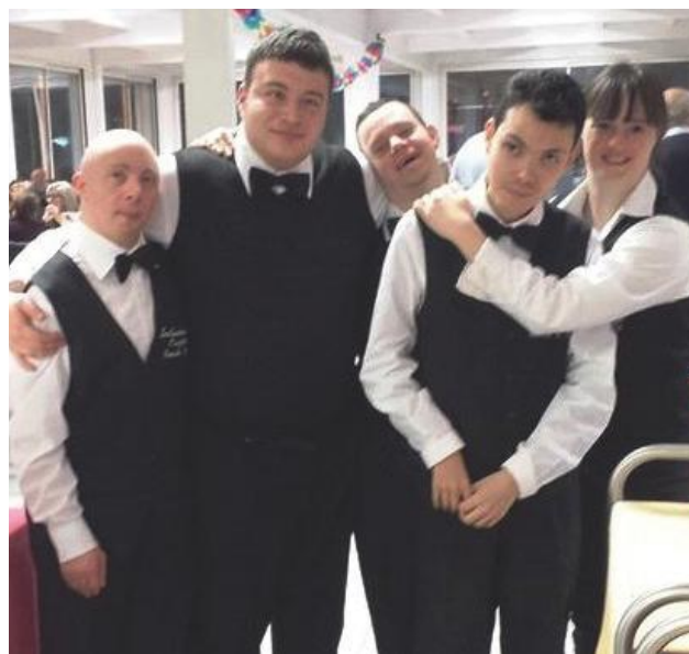
parte dello Staff dell'Inclusive Caffè di Giulianova (TE)

- il diritto alla pensione di invalidità viene mantenuto se il reddito totale annuo lordo non supera il euro 4.800,38.