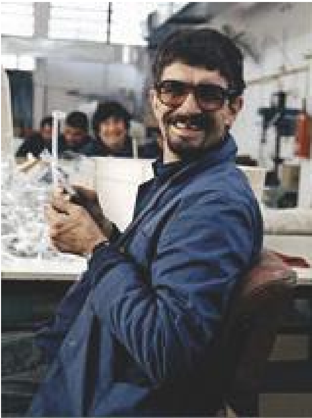
Joy of work (premiato dall'OMS nel concorso fotografico del 2001)

job coaching delle persone con disabilità, con particolare attenzione a chi richiede sostegni più intensi.