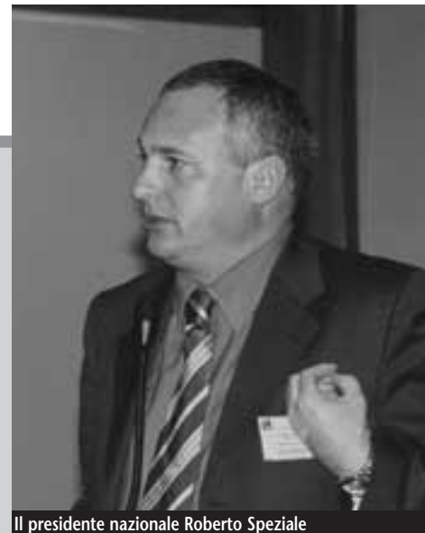
Il presidente nazionale Roberto Speziale

e della valutazione di gravità, dovrà essere realizzato un progetto personalizzato di integrazione, del quale faccia parte l'assistenza economica ma anche una rete diffusa ed articolata di servizi reali alla persona disabile.