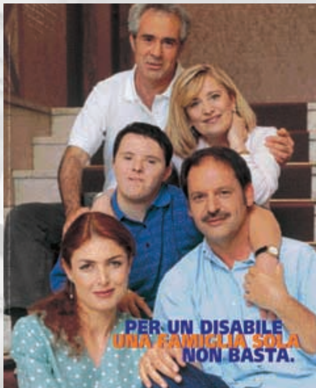
La famiglia, concetto guida della promozione Anffas