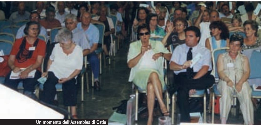
Un momento dell'Assemblea di Ostia