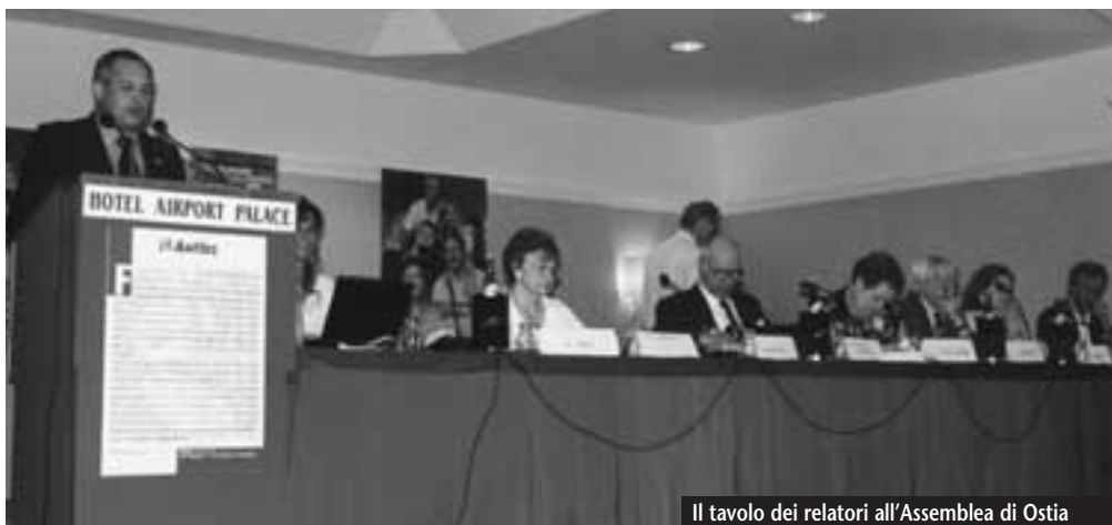
Il tavolo dei relatori all'Assemblea di Ostia

una volta si parla assai poco di presa in carico .